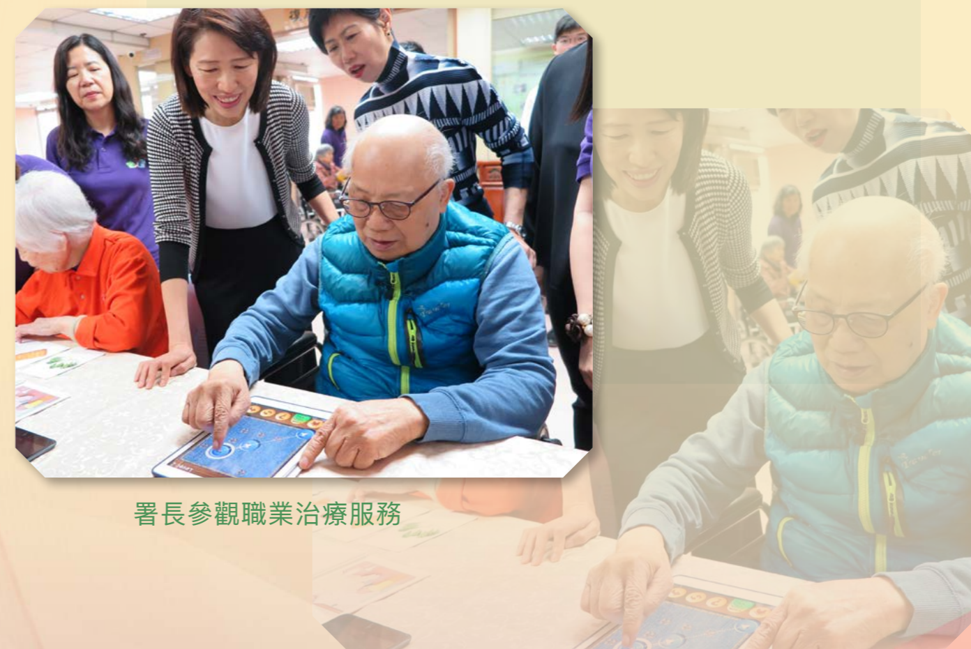
署長參觀職業治療服務