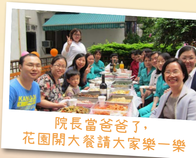
院長當爸爸了， 花園開大餐請大家樂一樂