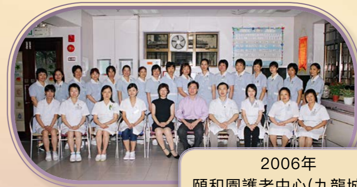
2006年 頤和園護老中心(九龍城院)