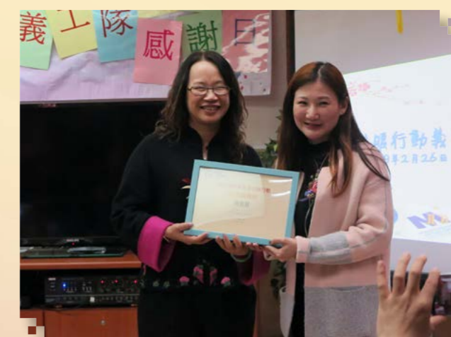
陳總監致送獎狀給嘉賓