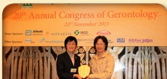
2013年衛生署署長 陳漢儀醫生 JP 頒授獎項