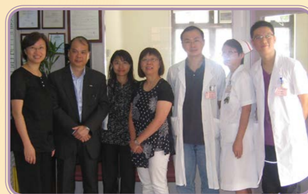
2010年·勞工福利局局長張健宗參觀