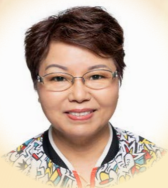
香港安老服務協會主席