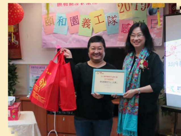
陳經理頒發獎項給紅磡院