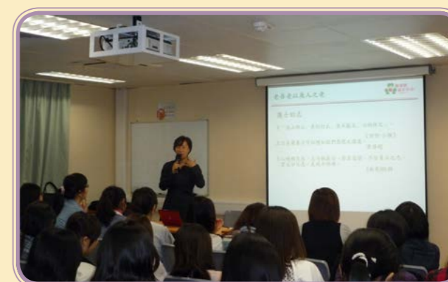
2011年·葛量洪護士學校分享會