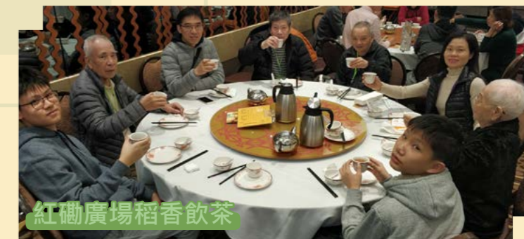
紅磡廣場稻香飲茶