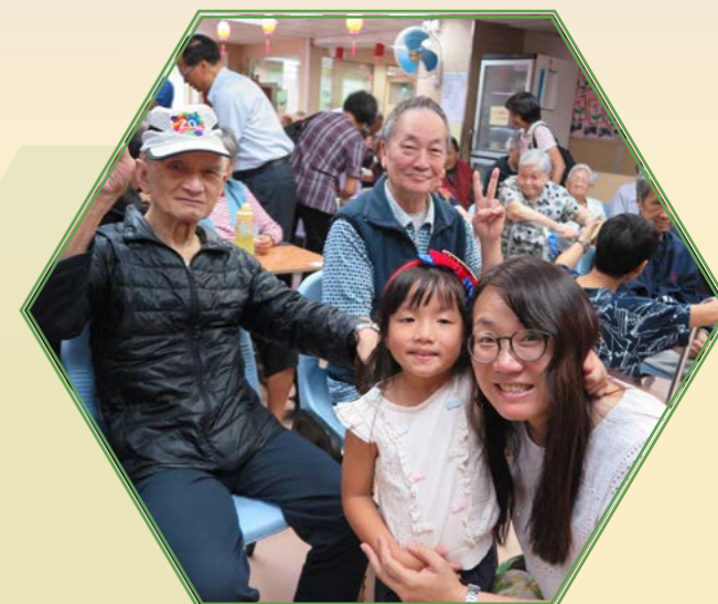
義工探訪 實踐長幼共融