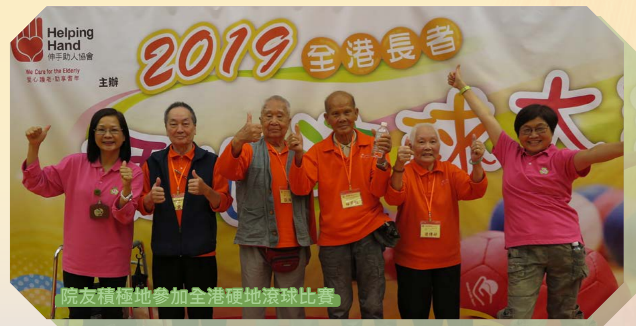
院友積極地參加全港硬地滾球比賽