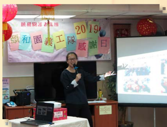
社工分享義工活動內容