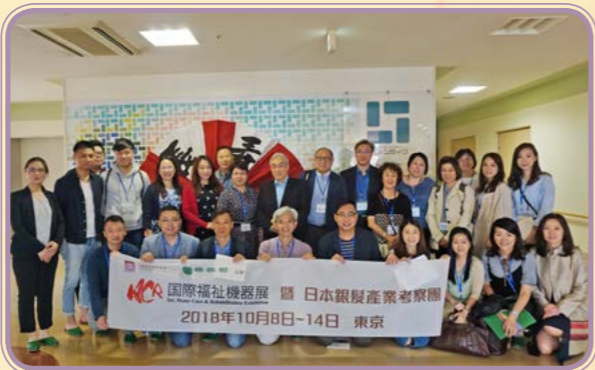
2018年 · 管理層日本考察