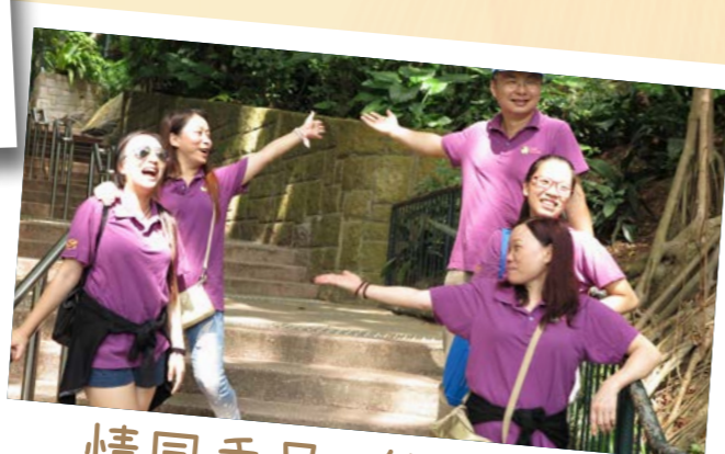
情同手足，休戚與共