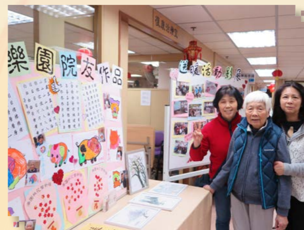
院友與家屬欣賞院友作品展