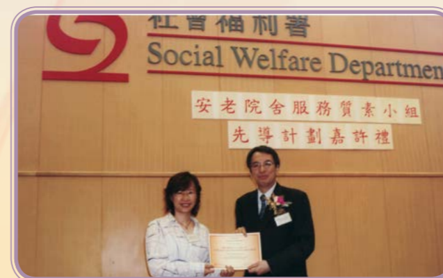
2004年·質素小組先導計劃嘉許禮

上述六項「國際健康照護品質協會」(ISQua) 對評審標準的認證原則，確立了香港老年學會「香港安老院舍評審計劃」所使用的“RACAS 40”評審標準已符合國際上對院舍評審的準則。當本港的安老院舍在參與及完成「香港安老院舍評審計劃」的評審而獲得有關認證，即表示這些院舍都能達到合適的水平，與其他先進國家安老院舍的服務水平相同。