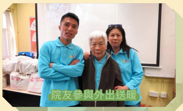
院友參與外出送暖