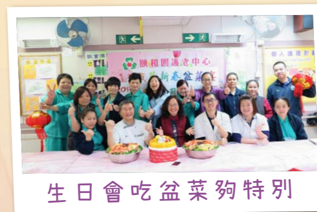
生日會吃盆菜夠特別