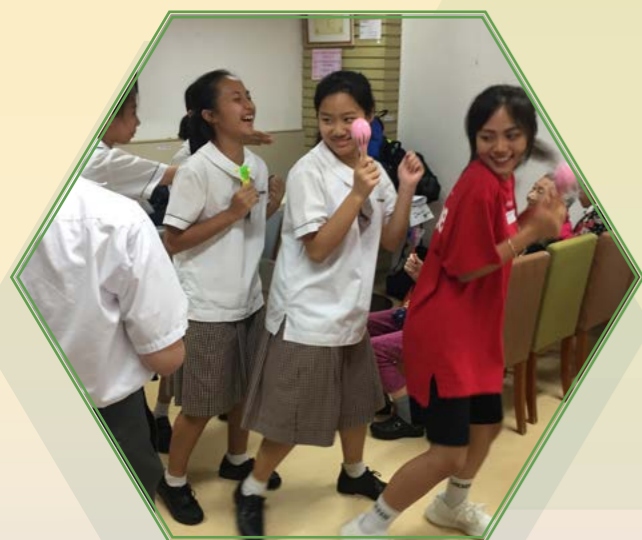
賽馬會官立中學探訪