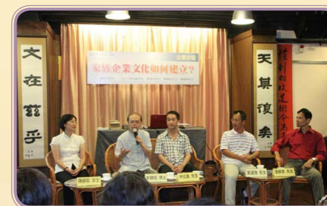
2012年·法住文化書院分享會