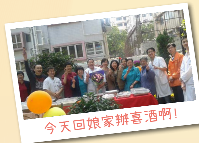
今天回娘家辦喜酒啊!