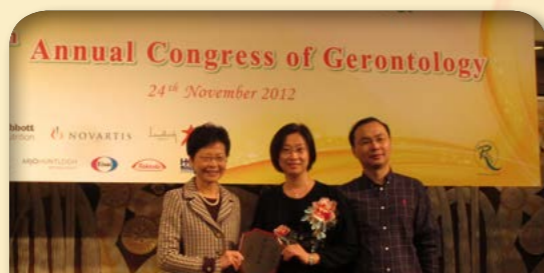
2012年政務司司長 林鄭月娥 GBS, JP 頒授獎項