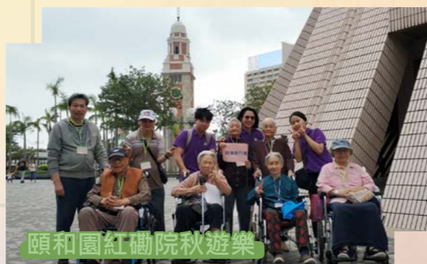
頤和園紅磡院秋遊樂