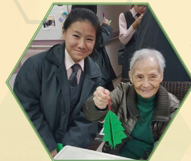
香港青年協會探訪