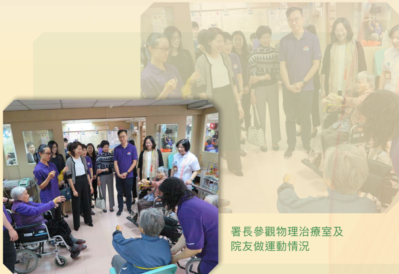
署長參觀物理治療室及院友做運動情況