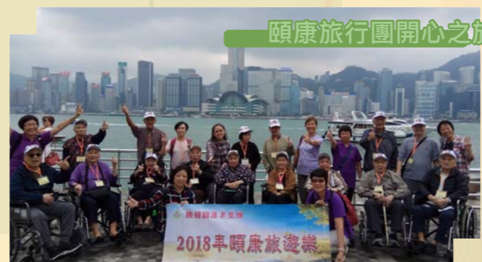
頤康旅行團開心之旅