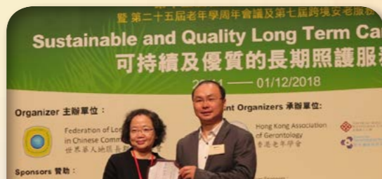
2018年社會福利署助理署長 黃燕儀女士頒授獎項

香港安老服務協會與香港職業發展服務處攜手合辦全港性的「安老服務業傑出員工嘉許活動」，藉此表揚具有卓越表現的前線及專業人員。他們的積極工作態度、傑出表現及對護老行業的委身精神，值得嘉許。