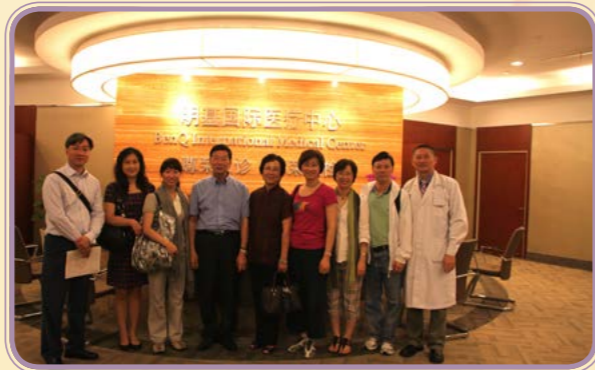
2010年6月 · 參觀南京明基醫院