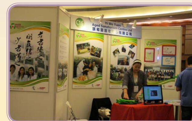
2011年·香港優質服務展覽會