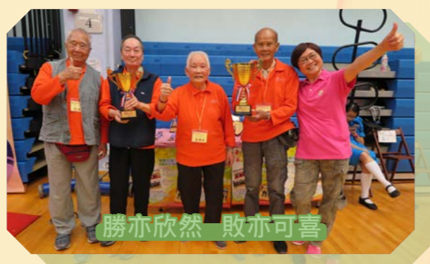
勝亦欣然 敗亦可喜