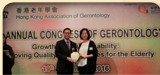
2016年社會福利署副署長 林嘉泰 JP 頒授獎項