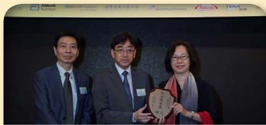
2015年香港政府食物及衛生局局長 高永文 GBS, JP 頒授獎項