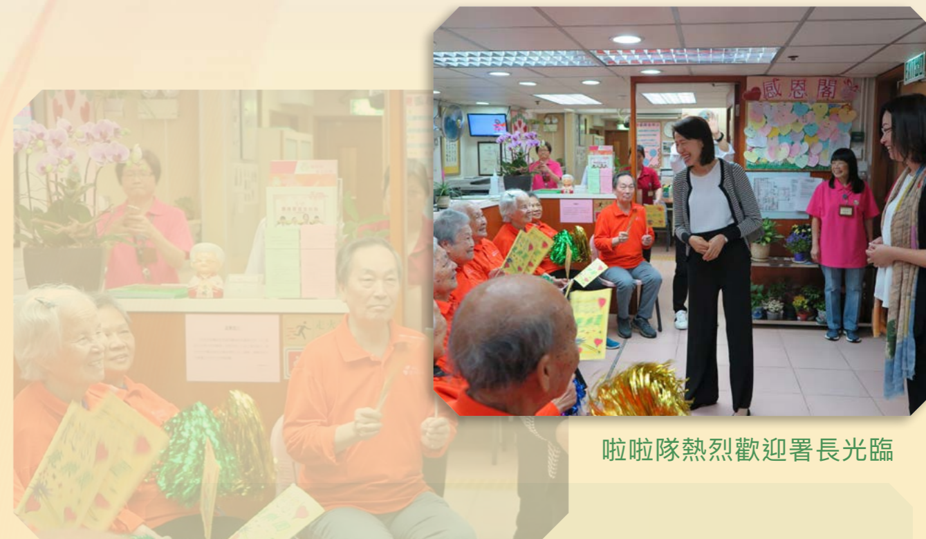
啦啦隊熱烈歡迎署長光臨