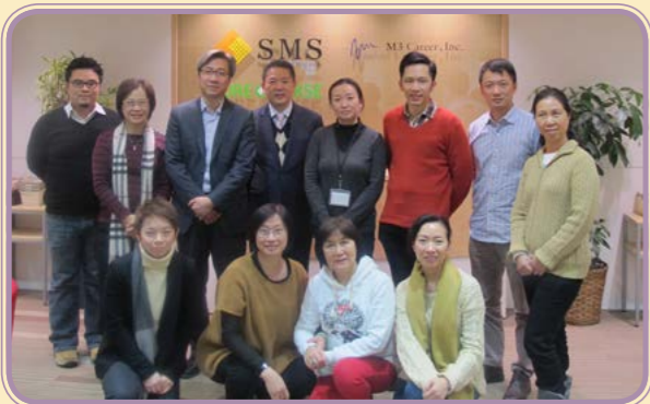
2014年 · 管理層日本考察