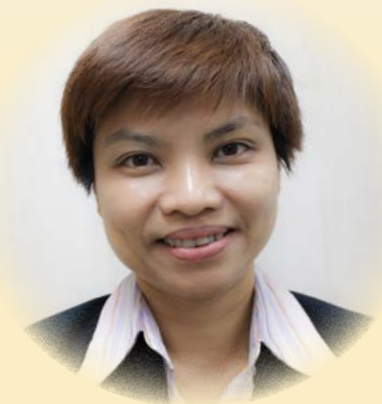
明愛康復服務總主任