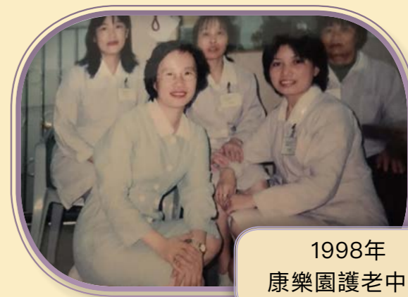
1998年 康樂園護老中心