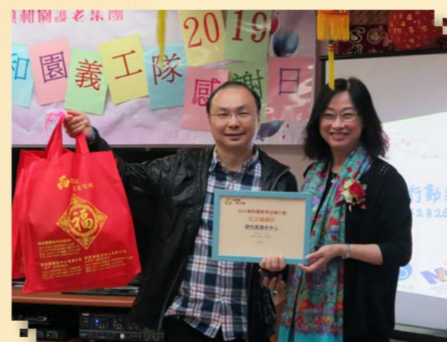
陳經理頒發獎項給界限街院舍