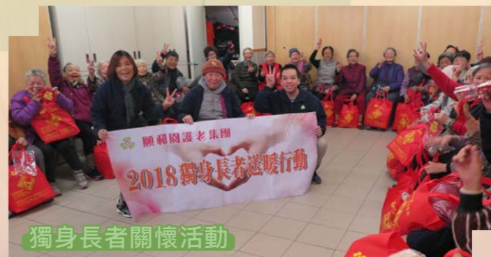
獨身長者關懷活動