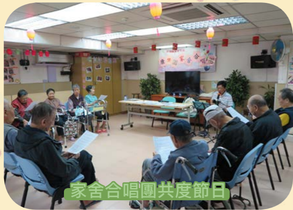
家舍合唱團共度節日