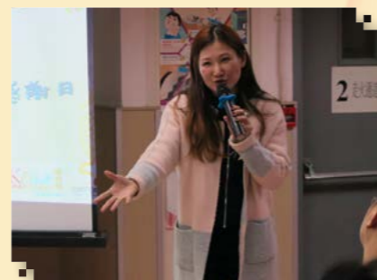
嘉賓在會上分享得獎感受