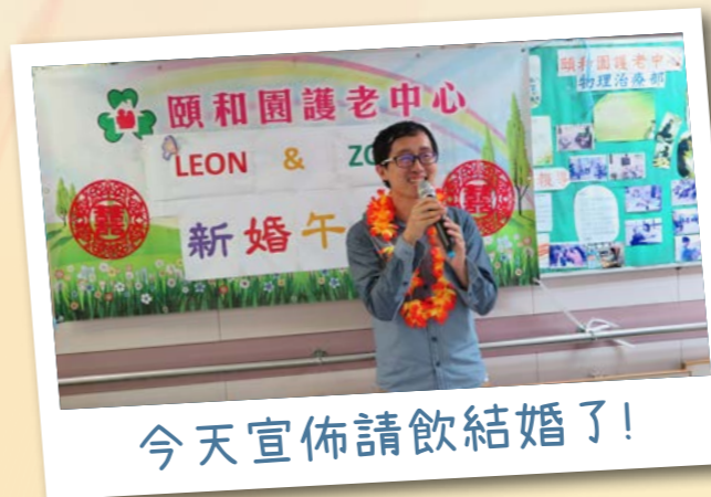
今天宣佈請飲結婚了!