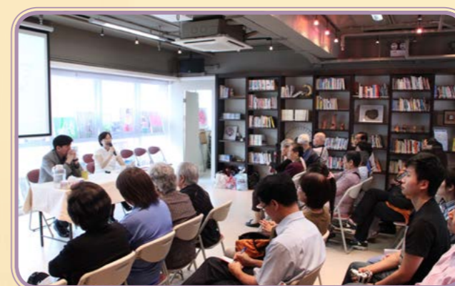
2011年·典範文化分享會