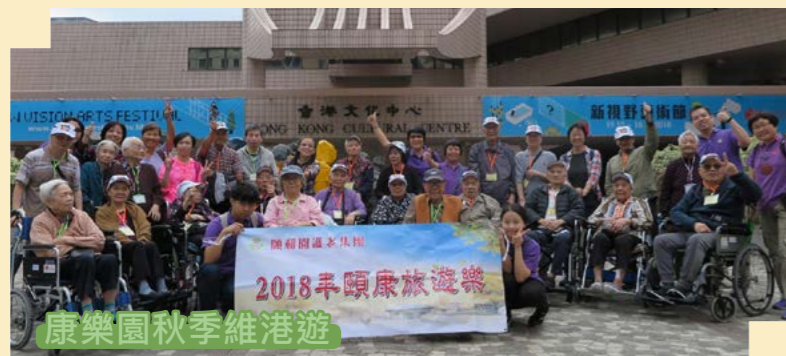
康樂園秋季維港遊