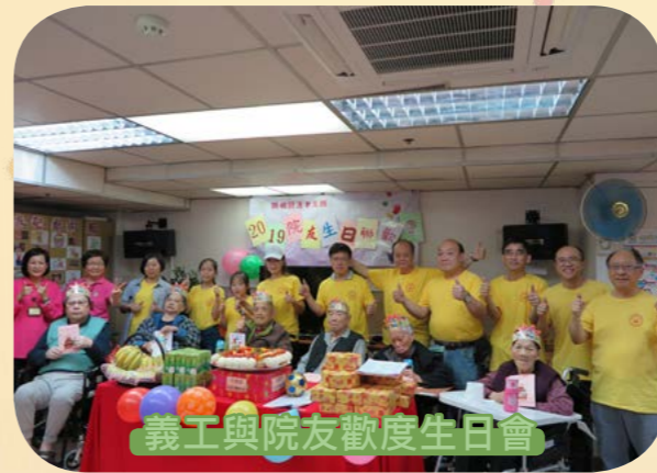
義工與院友歡度生日會