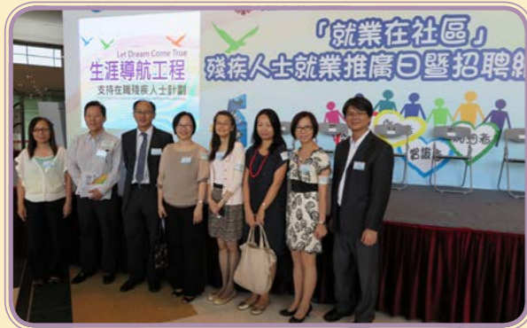
2014年9月 · 明愛復康招聘日