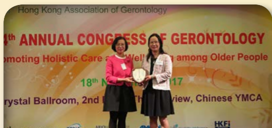
2017年食物及衛生局局長 陳肇始教授頒授獎項