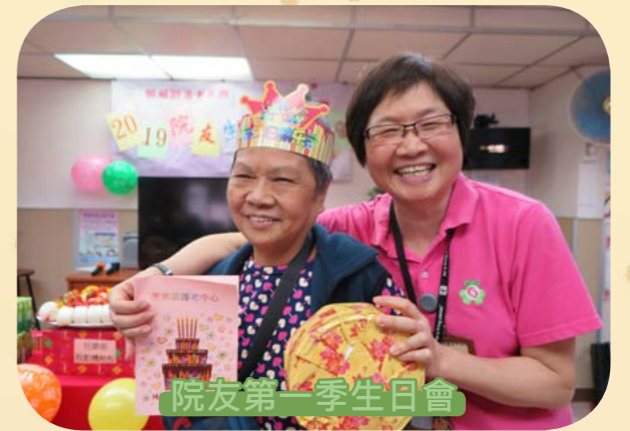
院友第一季生日會