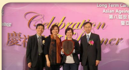
2011年社會福利署署長聶德權頒授獎項