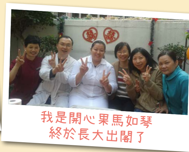
我是開心果馬如琴 終於長大出閣了