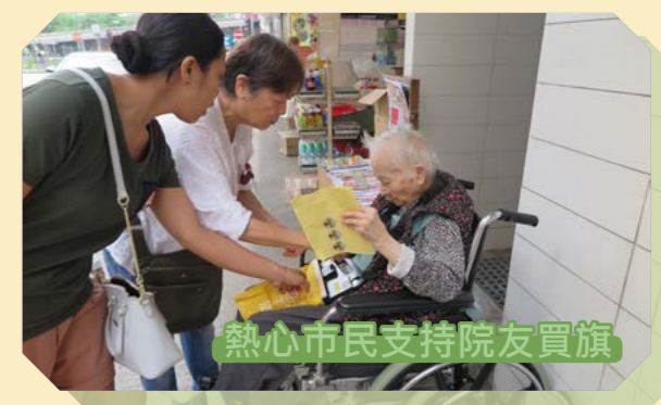
熱心市民支持院友賣旗