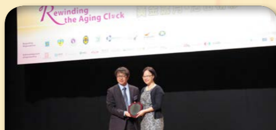
2014年勞工及福利局副局長 蕭偉強 JP 頒授獎項