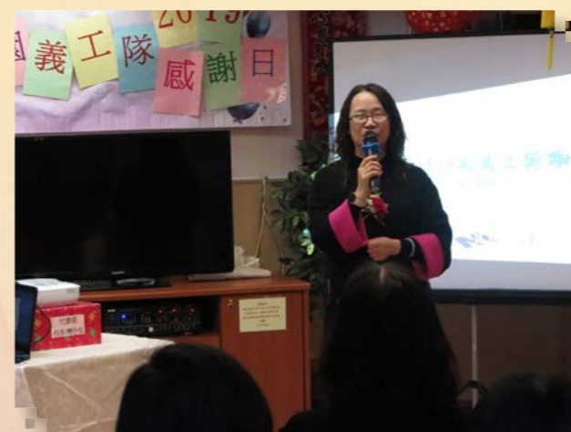
陳總監在會上致辭