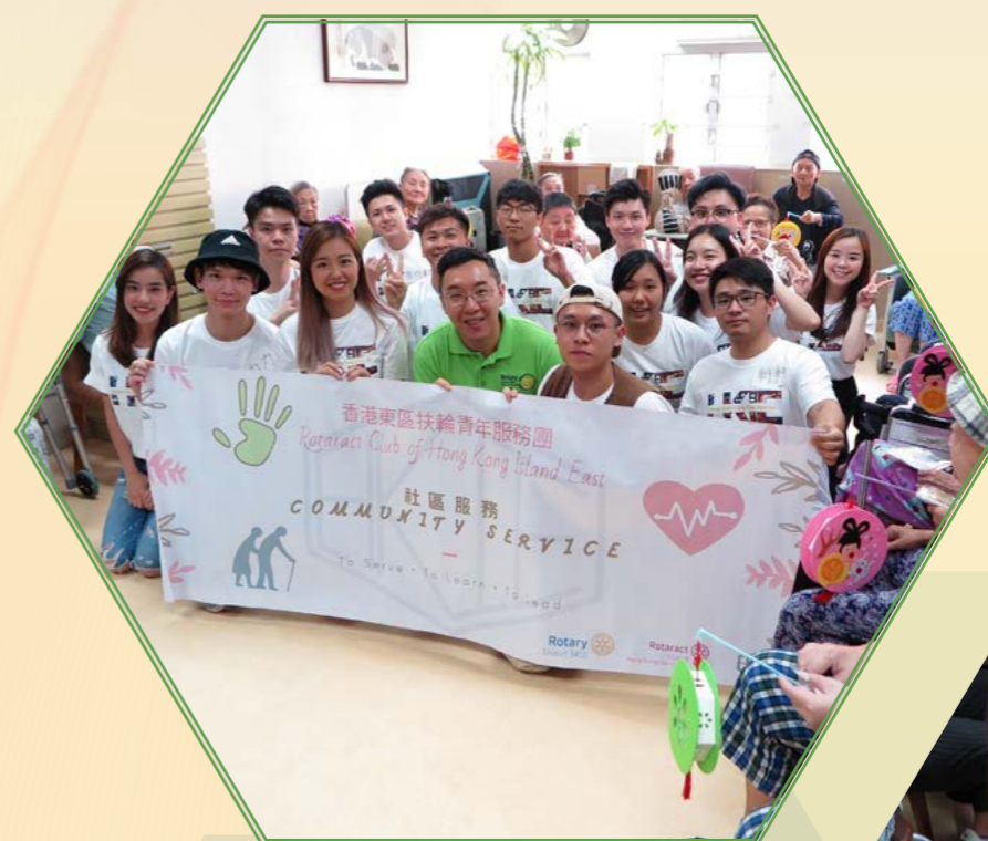
香港東區扶輪青年服務團探訪