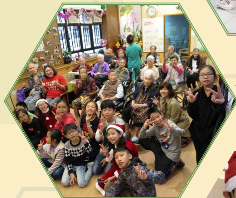
九龍城福音堂(兒童堂)探訪