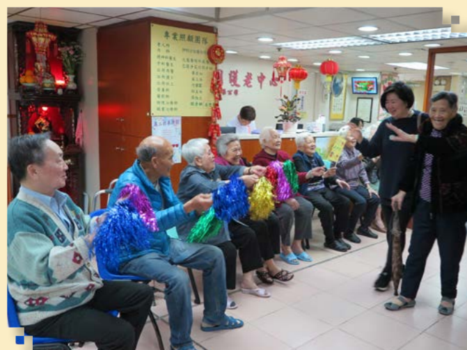
康樂園啦啦隊熱烈歡迎嘉賓來臨

為感謝義工們在「獨身長者送暖行動」中的付出，以及一同分享助人的喜悅。集團特意在2019年2月於旗下康樂園護老中心舉辦「義工感謝日」，答謝各界（包括社區、家屬、院友及職員義工）的支持。