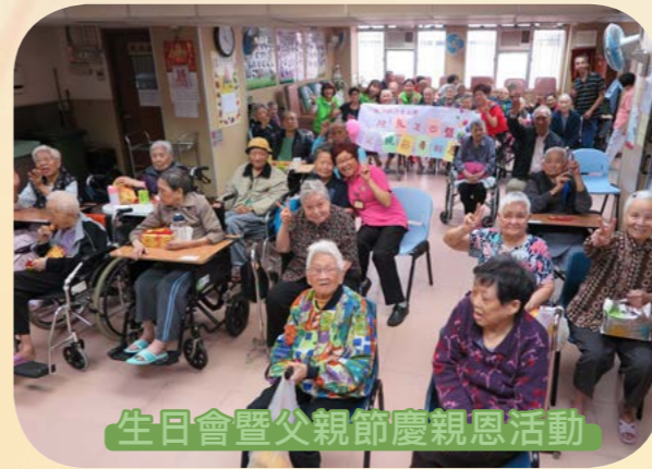
生日會暨父親節慶親恩活動