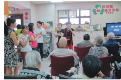
同樂會義工們表演唱歌, 公公婆婆聽到聚精會神