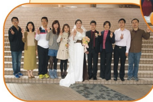
開心果馬如琴結婚了