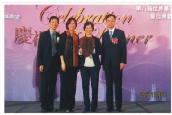
2011年獲老年學會頒發全線院舍「安老院舍優質服務全面參與獎」，社會福利署署長蔣德權先生頒獎，本機構連同其他4間機構獲此殊榮。