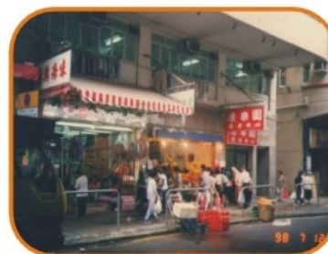
1997年位於九龍城道10-16號聯業大廈「康樂園護老中心」成立 面積3500呎，提供床位31張