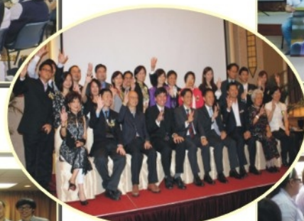
十八個月高層主管培訓