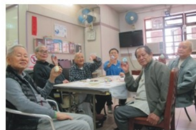
好Yeah~自己整既製成品