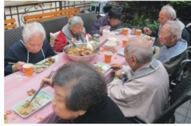
「2013新春盆菜宴」 公公婆婆食到讚不絕口!