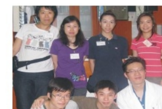
扶康會保健員實習生