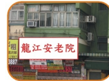
1994年位於九龍紅磡馬頭圍道「龍江安老院」正式成立 面積1000呎，提供床位16張