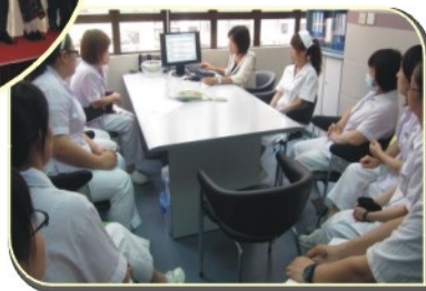
每月內部專業培訓