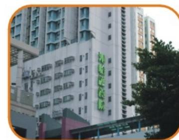
2007年「頤和園護老中心有限公司」投得社會福利署合約護養院舍 2008年5月「紫雲閣沁怡護養院」成立 面積60000呎，提供床位205張