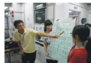
基督教靈實協會保健員實習生