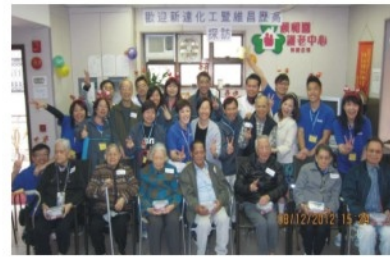
新達維昌探訪大合照