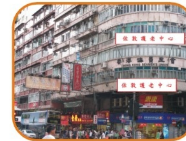
1994年位於九龍佐敦道統一大廈的「佐敦護老中心」成立 面積5000呎，提供床位53張