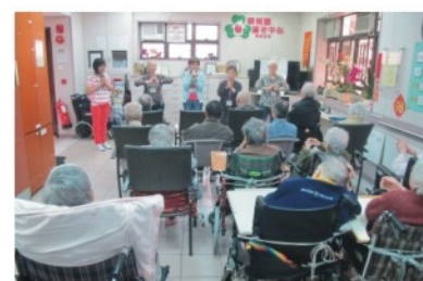
基督教耆福會探訪- 跳讀美操