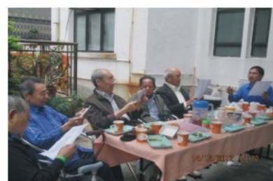
一邊飲下午茶, 一邊唱歌, 真係一大享受