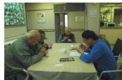
每位公公都好投 入整復活蛋嗎!