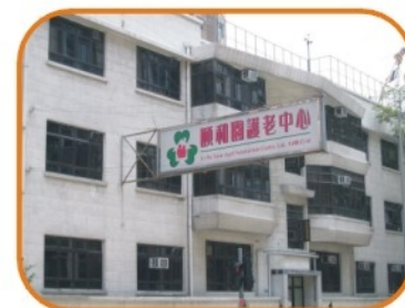
2001年位於九龍界限街172-174號全幢「頤和園護老中心有限公司」成立 面積10000呎，提供床位124張