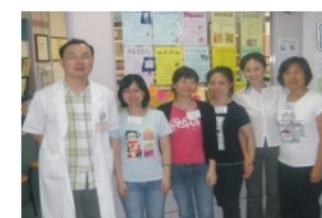
老年學會保健員實習生