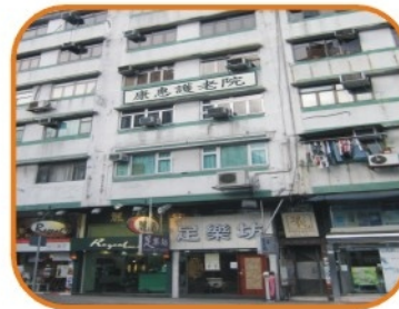
1990年位於九龍城聯合道的「康惠護老中心」成立 面積1000呎，提供床位19張

香港安老院始於六十年代，由少數宗教團體為獨居無依長者提供住宿照顧，六十年代末，為回應社區的需要，各志願機構〔即現時的非政府機構〕紛紛引入外國新的服務模式，例如：社康護理、家務助理及老人宿舍等，進入七十年代老年人口大幅上昇，出現非政府機構營辦安老院舍。八十年代香港步入人口老化，為回應社區的需要，私營院舍在這時期應運而生，九十年代初醫管局成立，私營安老院舍急速轉型為護理單位，為急切需要安老服務的長者提供最前線的照顧，扮演着一個非常重要的角色，私營安老院舍開始從家居服務轉型為護理服務。