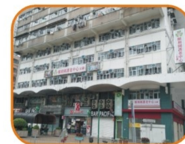
2013年「頤和園護老中心(紅磡)」成立 面積16000呎，提供床位186張