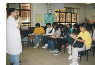
香港專上教育學院學生