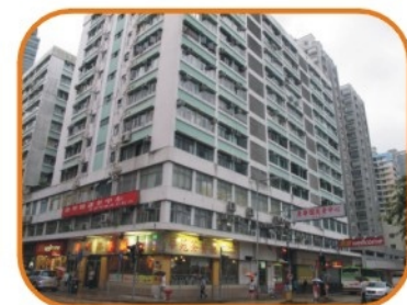
1999年位於九龍土瓜灣馬坑涌道5B-5F中華商場「康樂園護老中心有限公司」成立 面積18000呎，提供床位196張。