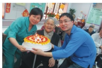
有你地同我慶祝生日, 我真係好開心啊!