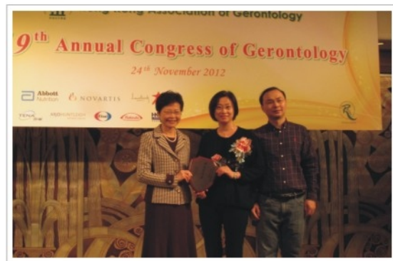
2012年獲老年學會頒發全線院舍「安老院舍優質服務全面參與獎」，政務司司長林鄭月娥女士頒獎，本機構連同其他7間機構獲此殊榮。