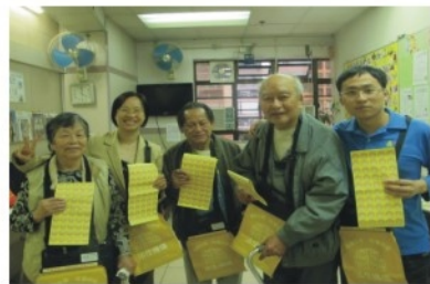
好厲害哦! 個個 賣旗做義工