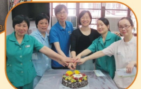
六位壽星仔女一齊切蛋糕~~