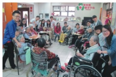
個個年輕仔女對 公公婆婆都好親切哦~~